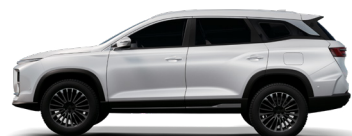
NEW KHAKI WHITE أبيض