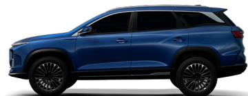
DEEP SEA BLUE أزرق غامق