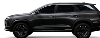
STARRY SKY BLACK أسود