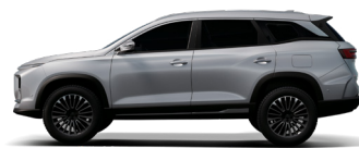
TECHNO GREY فيراني فاتح