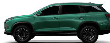
AROURA GREEN أخضر