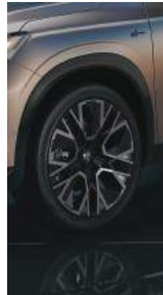
20" Alpine altitude twin color alloy wheels جنوط رياضية ثنائية اللون مقاس ٢٠ بوصة