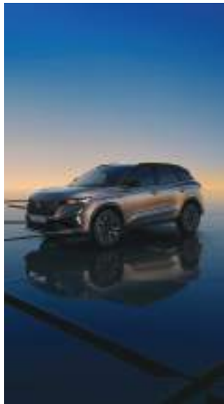
new Renault Austral رينو أوسترال الجديدة