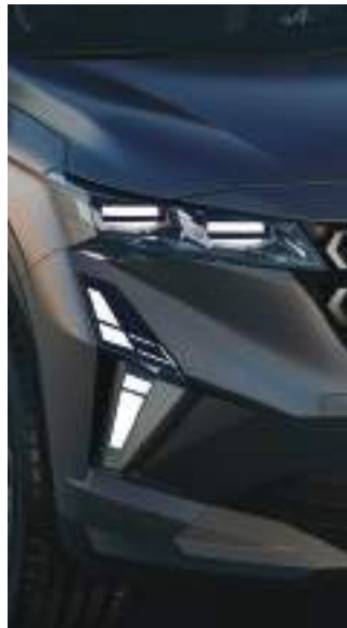
full LED headlamps نظام إضاءة LED متكامل للمصابيح الأمامية