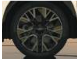
20" Alpine altitude smokey grey diamond-cut alloy wheel rim (2) جنوط رياضية ثنائية اللون مقاس ٢٠ بوصة (٢)

(1) available as standard on techno and iconic versions. (2) available as standard on esprit Alpine version.