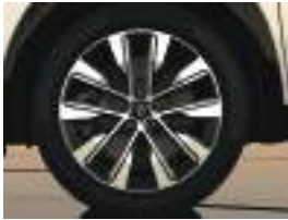
19" komah diamond-cut alloy wheel rim (1) جنوط رياضية ثنائية اللون مقاس ١٩ بوصة (1)