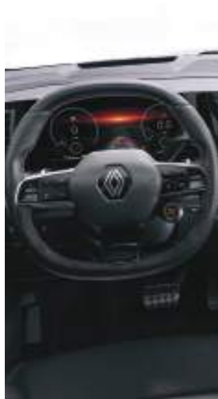
Alcantara steering wheel with leather inserts عجلة قيادة من الكاترا والجلد