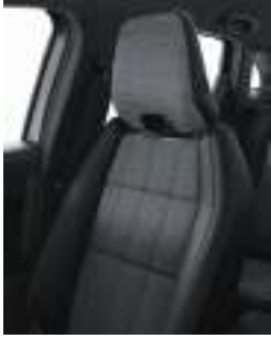
mixed imitation leather / gradient grey fabric (1) upholstery مقاعد جلد مع قماش (1)