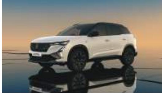
white matte with diamond black roof*