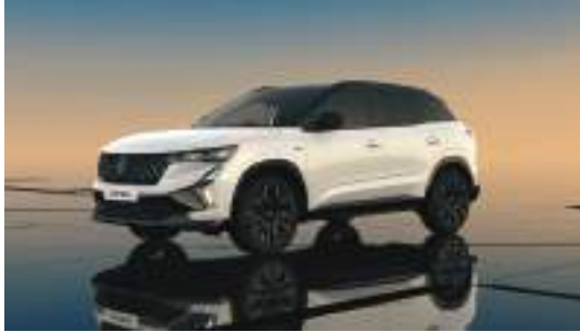
arctic white with diamond black roof*