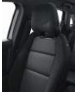
mixed carbon fabric / Alcantara® upholstery / blue top-stitching (2) مقاعد رياضية من الكانترا والجلد (٢)

(1) available as standard on techno and iconic versions. (2) available as standard on esprit Alpine version.