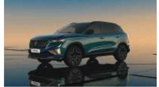
naxos blue with diamond black roof*