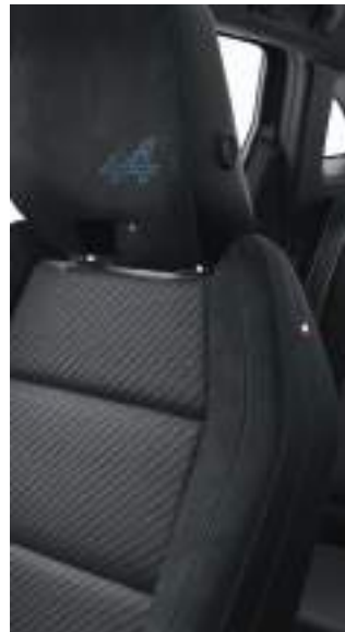
Alcantara ergonomic seats with leather inserts مقاعد رياضية من الكاترا والجلد