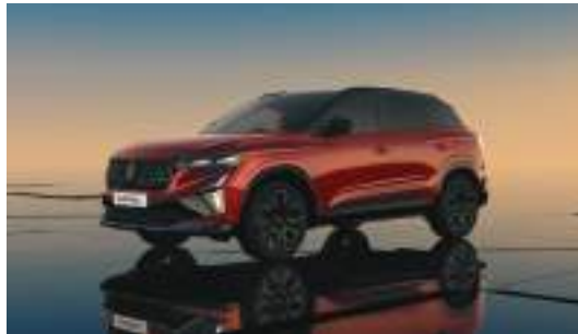
flame red with diamond black roof*