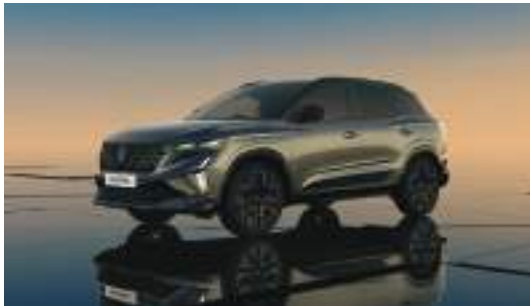
shadow grey with diamond black roof*