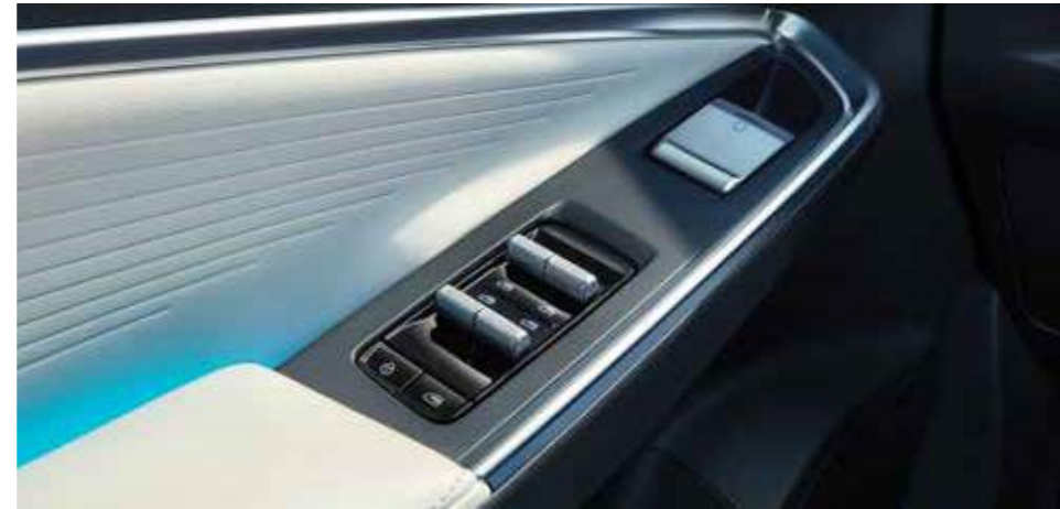
أربعة أبواب نوافذ كهربائية تفتح وتغلق بلمسة واحدة FOUR-DOOR ONE-TOUCH POWER WINDOWS