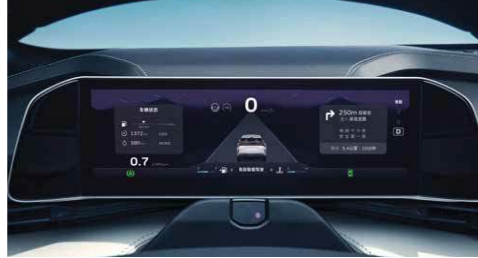
شاشة عرض TFT عالية الوضوح قياس 10.25 بوصة 10.25" HI-DEFINITION TFT CLUSTER