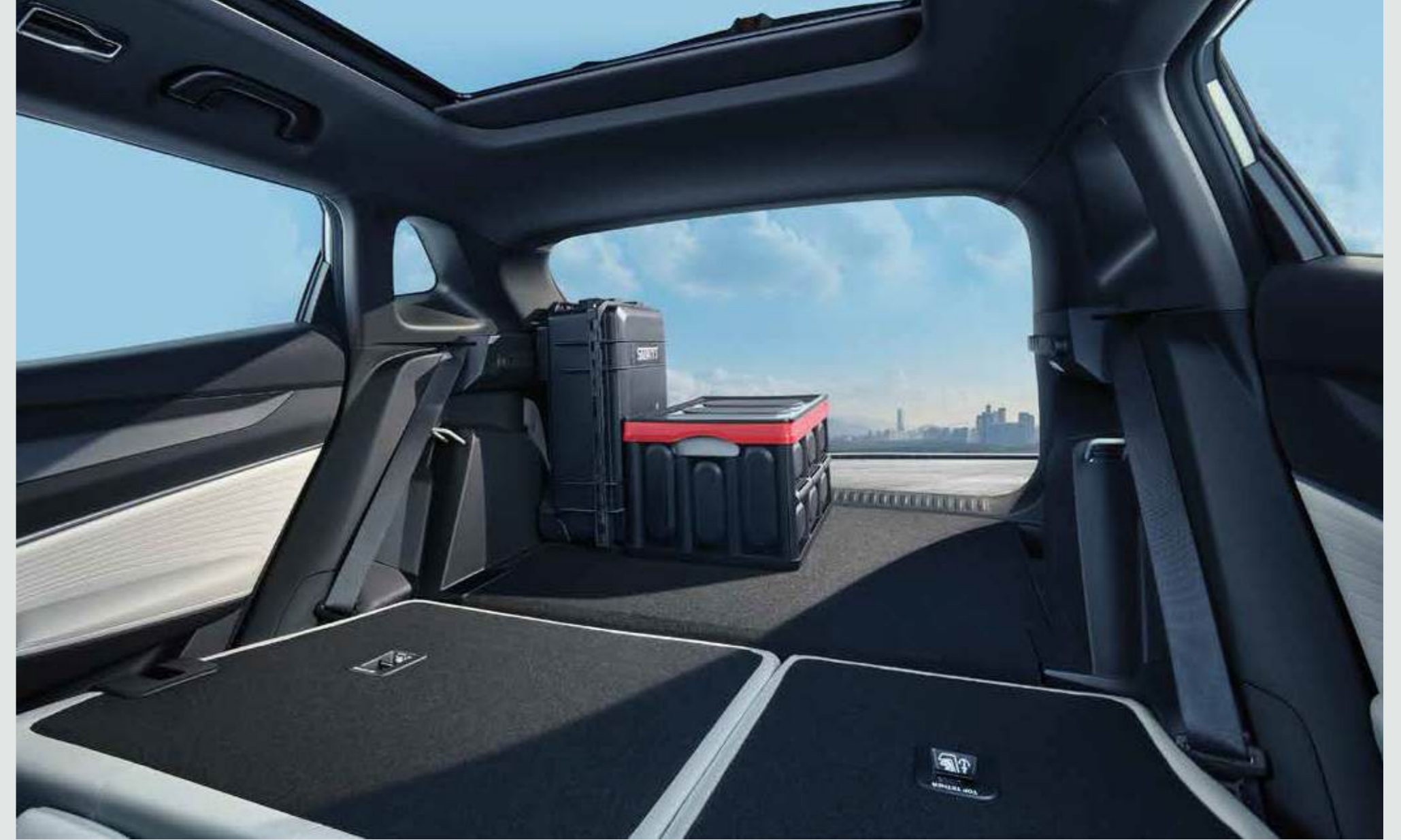
FOLDING SEATS WITH SPACIOUS CARGO SPACE