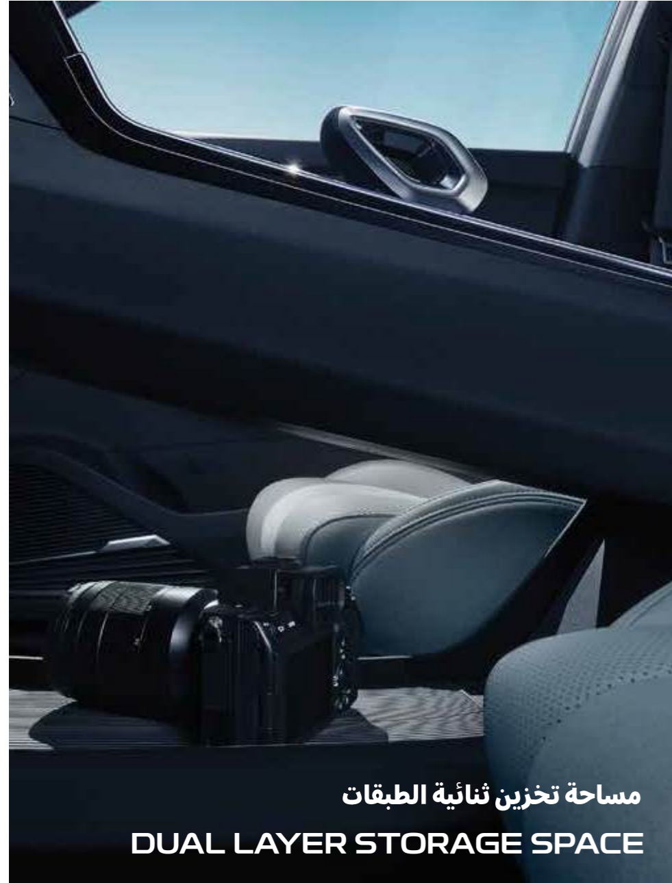
مساحة تخزين ثنائية الطبقات DUAL LAYER STORAGE SPACE